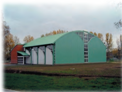
A 2003-ban átadott Tornacsarnok