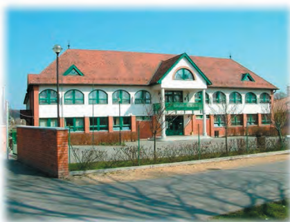
Az 1994-ben átadott Iskola