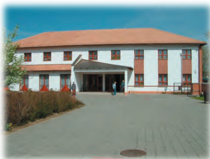
A 2002-ben átadott 120 férőhelyes Kollégium