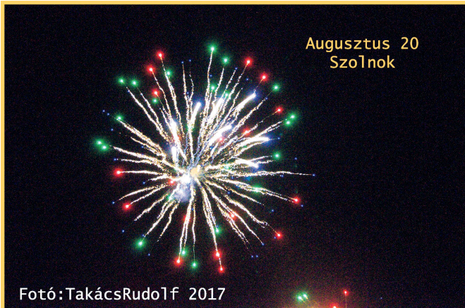
Augusztus 20 Szolnok