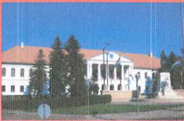
Makói Járási Hivatal