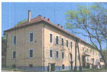
Csongrádi Járási Hivatal