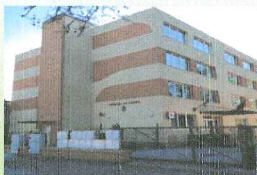
Hódmezővásárhelyi Járási Hivatal