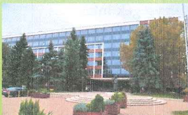
Szegedi Járási Hivatal