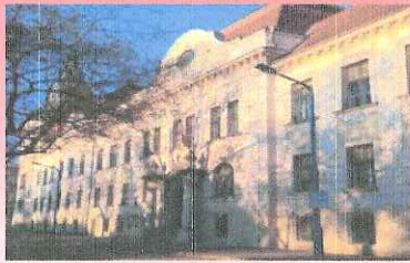
Szentesi Járási Hivatal