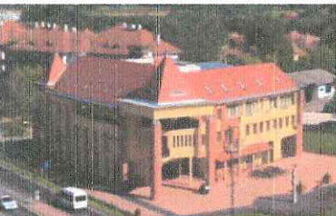
Mórahalmi Járási Hivatal