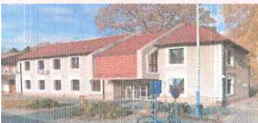
Kisteleki Járási Hivatal