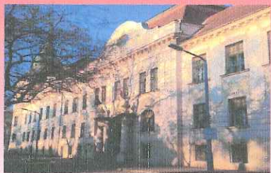
Szentesi Járási Hivatal