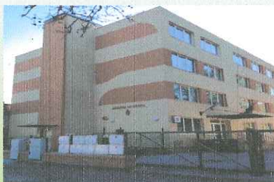
Hódmezővásárhelyi Járási Hivatal