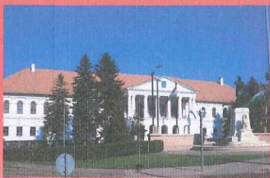
Makói Járási Hivatal