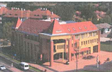
Mórahalmi Járási Hivatal