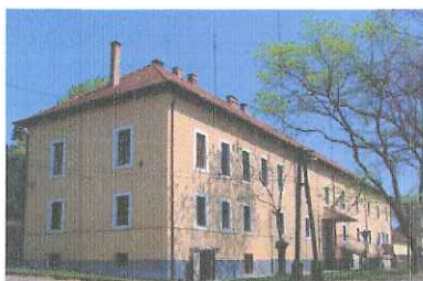
Csongrádi Járási Hivatal