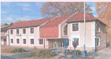
Kisteleki Járási Hivatal