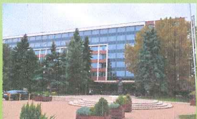
Szegedi Járási Hivatal