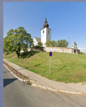
[Balatonalmádi, Vörösberény református templom 1930 körül és napjainkban]