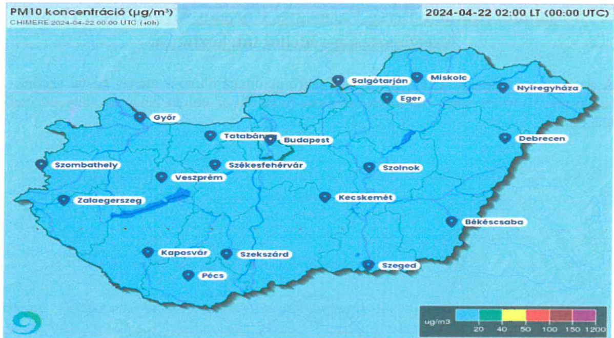
Országos PM 10 koncentráció jelenlegi helyzete