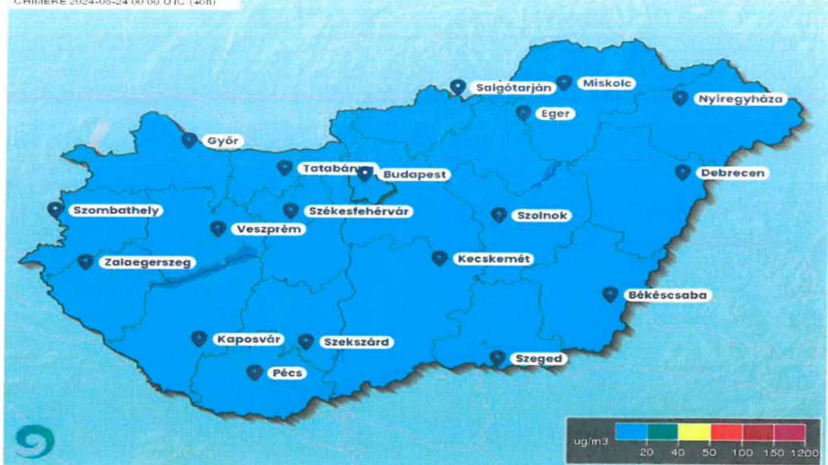
Országos PM 10 koncentráció jelenlegi helyzete