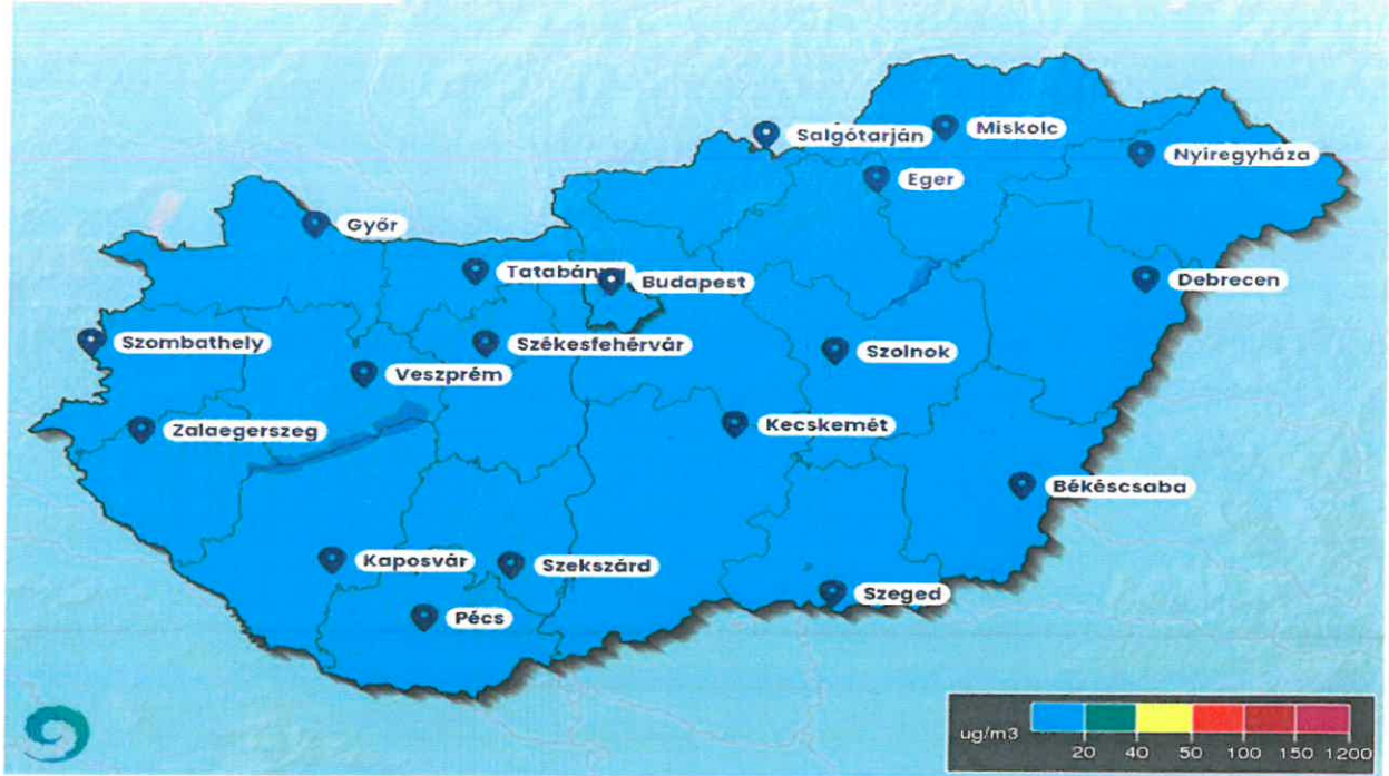
Országos PM 10 koncentráció jelenlegi helyzete