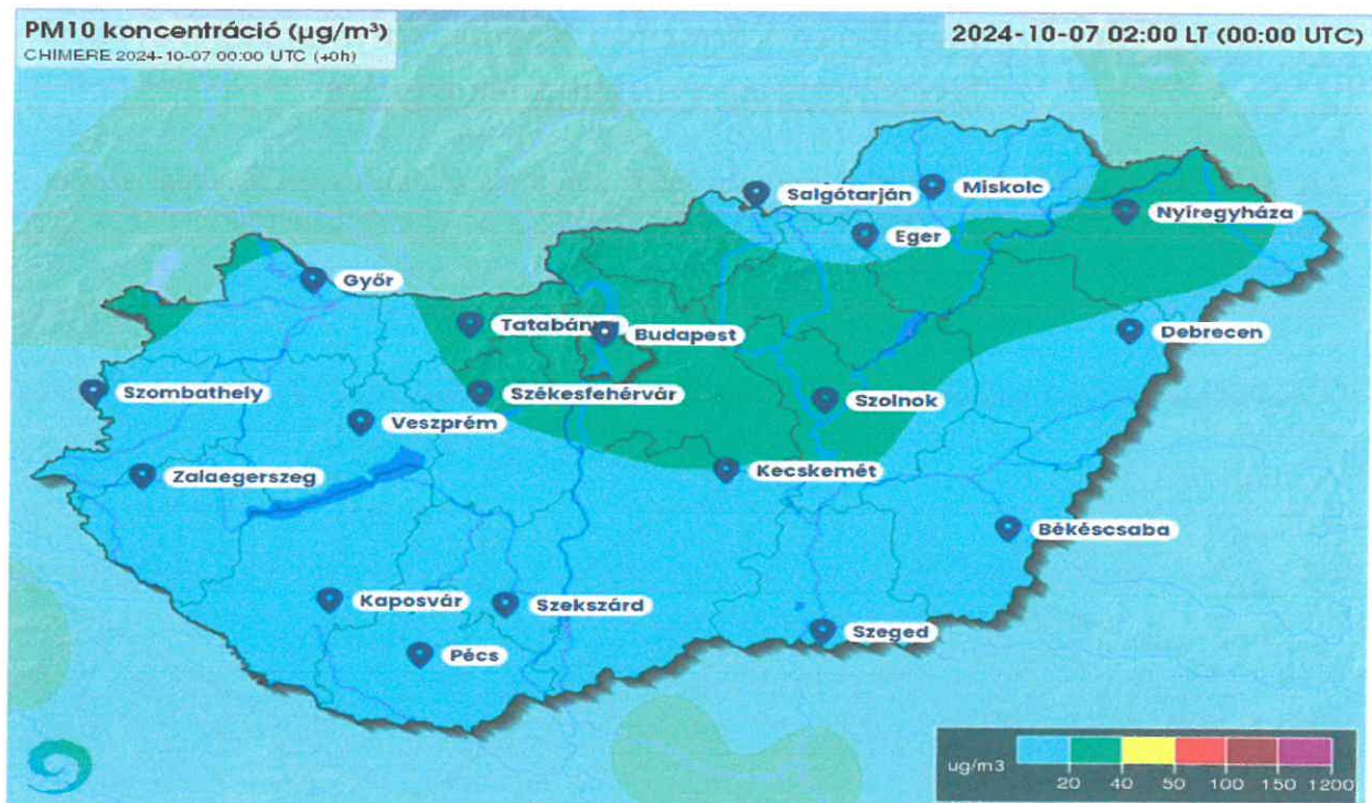
Országos PM 10 koncentráció jelenlegi helyzete forrás – www.legszenyezettseg.met.hu