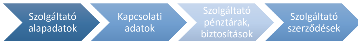
1. ábra: Szolgáltató adatai oldalon megjelenő kártyák

A felhasználó a kiválasztott képviselő adatait a Szolgáltatói adatok menüponton keresztül éri el. Az oldalon megtalálható információkat négy szekcióba rendezve tekintheti meg: