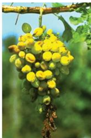
Zsugorodó bogyók