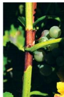
Egyetlen fásodás