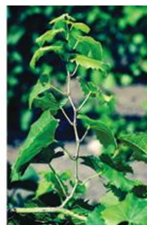
Ízközök rövidülése