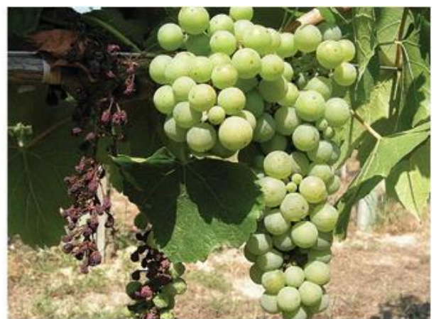
Megbarnult bogyók