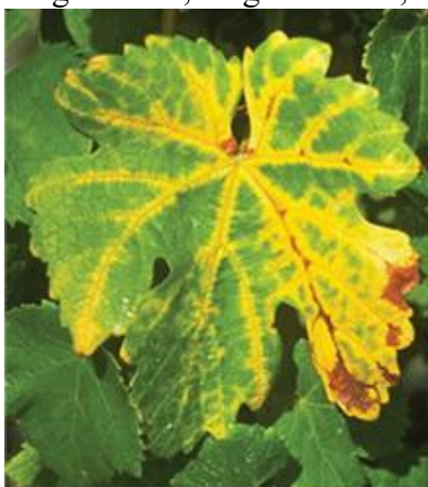
Levél sárgulás

Augusztus és szeptember hónapokban a főerek mentén krémsárga foltok jelennek meg, amelyek fokozatosan terjednek a levélfelületen, végül a teljes levél elszárad. Az így elhalt, megkeményedett levelek ősszel később hullanak le, mint az egészségesek. Télen a be nem értett vesszők elfeketednek és elpusztulnak. A következő tavasszal a megmaradt rügyekből keletkező virágzat leszárad, kevesebb fürt képződik. Késői fertőzés esetén a bogyók zsugorodnak, megbarnulnak, rossz ízűvé válnak.