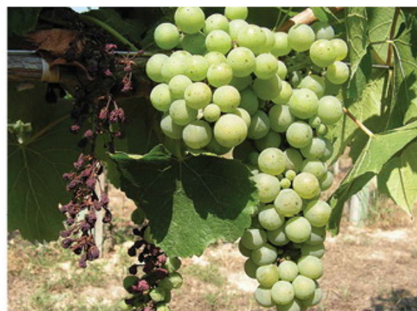
Megbarnult bogyók