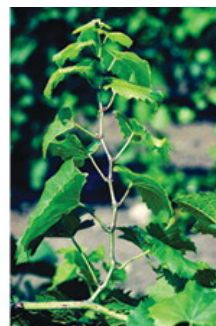
Ízközök rövidülése