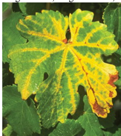
Levél sárgulás

Augusztus és szeptember hónapokban a főerek mentén krémsárga foltok jelennek meg, amelyek fokozatosan terjednek a levélfelületen, végül a teljes levél elszárad. Az így elhalt, megkeményedett levelek ősszel később hullanak le, mint az egészségesek. Télen a be nem érett vesszők elfeketednek és elpusztulnak. A következő tavasszal a megmaradt rügyekből keletkező virágzat leszárad, kevesebb fürt képződik. Késői fertőzés esetén a bogyók zsugorodnak, megbarnulnak, rossz ízűvé válnak.