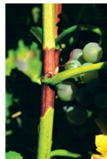
Egyetlen fásodás