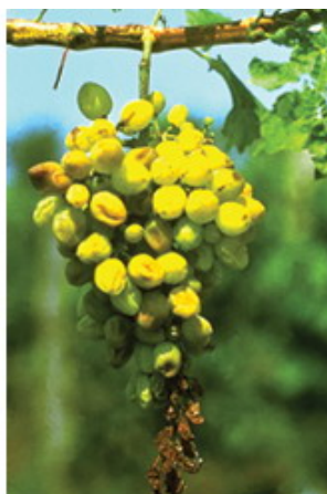
Zsugorodó bogyók