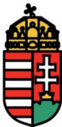
„A”, „C”, „D”

A legnagyobb különbség az eddigi és az új rendszám táblák között a címer, mely az alábbiak szerint szerepel a rendszám táblákon: