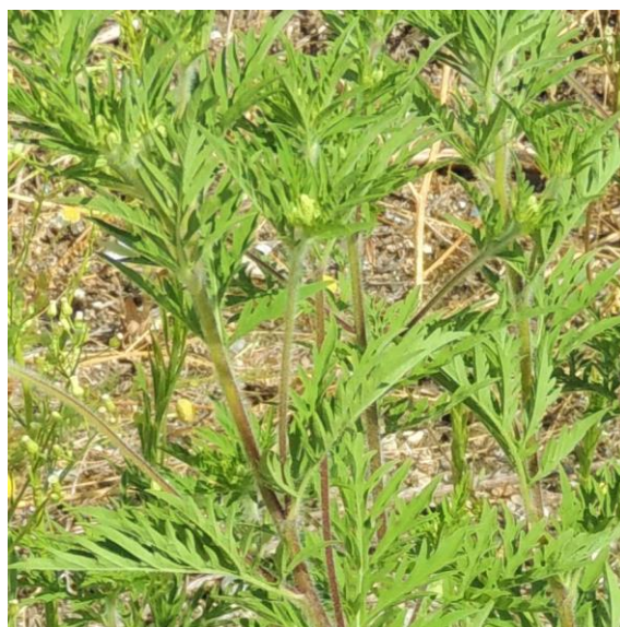
Parlagfű korai virágbimbós állapotban

Ez a földtulajdonosokra és a földhasználókra vonatkozóan lerövidíti a parlagfűvel fertőzött területek esetében a terület mentesítésére rendelkezésre álló határidőt. Ha egy területre vonatkozóan bejelentés érkezik, akkor a hatóságnak 5 napon belül ki kell vonulnia a területre ellenőrzés céljából, és ha a bejelentés megalapozottnak bizonyul (a területen virágbimbós állapotú parlagfű jelenlétét tapasztalják), jegyzőkönyv felvételére kerül sor, és megindul az eljárás, melynek végén növényvédelmi bírság kiszabására kerül sor.