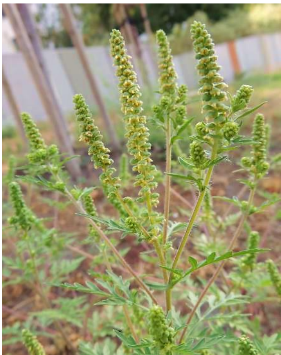
Parlagfű teljes virágzásban

Ez a földtulajdonosokra és a földhasználókra vonatkozóan lerövidíti a parlagfűvel fertőzött területek esetében a terület mentesítésére rendelkezésre álló határidőt. Ha egy területre vonatkozóan bejelentés érkezik, akkor a hatóságnak 5 napon belül ki kell vonulnia a területre ellenőrzés céljából, és ha a bejelentés megalapozottnak bizonyul (a területen virágbimbós állapotú parlagfű jelenlétét tapasztalják), jegyzőkönyv felvételére kerül sor, és megindul az eljárás, melynek végén növényvédelmi bírság kiszabására kerül sor.