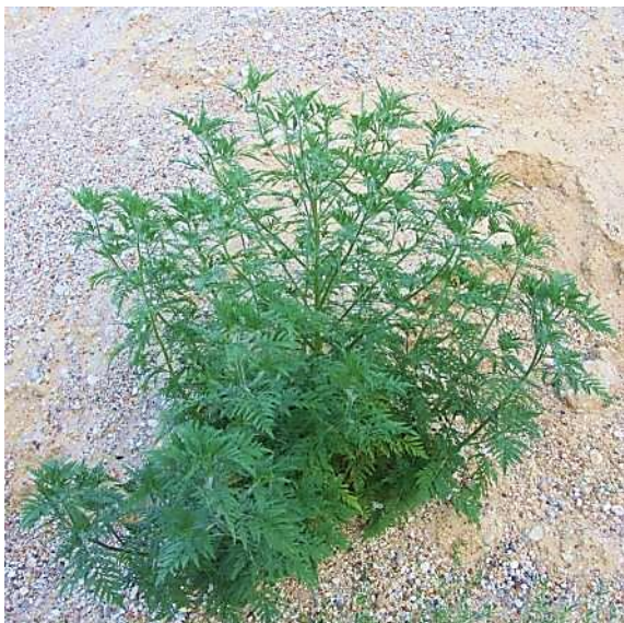
Parlagfű növény

Az Éltv. 50. § (7) bekezdése az alábbiak szerint módosult: