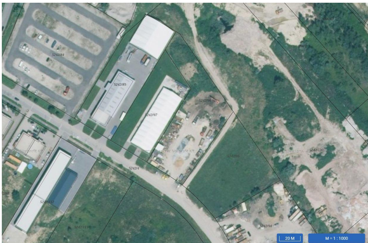
1. ábra: Műholdas felvétel a tervezési területről és környezetéről

Az ingatlan tulajdonosa: Németh 2001 Kft. (saját tulajdonú)