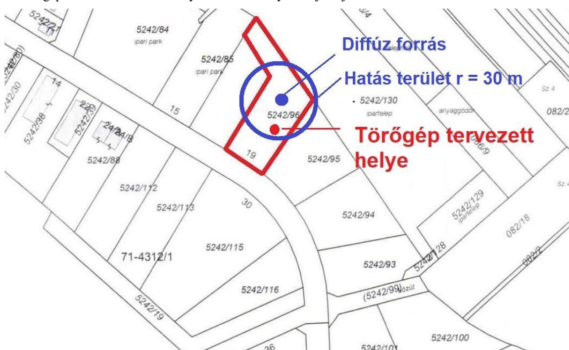
6. ábra: Törő gép elhelyezkedése

A törő gép tervezett üzemelési helyét az alábbi helyszínrajzon jelöltük: