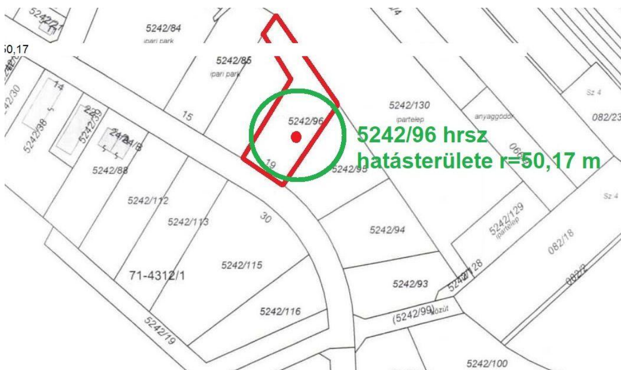
7. ábra: Hatásterület ábrázolása