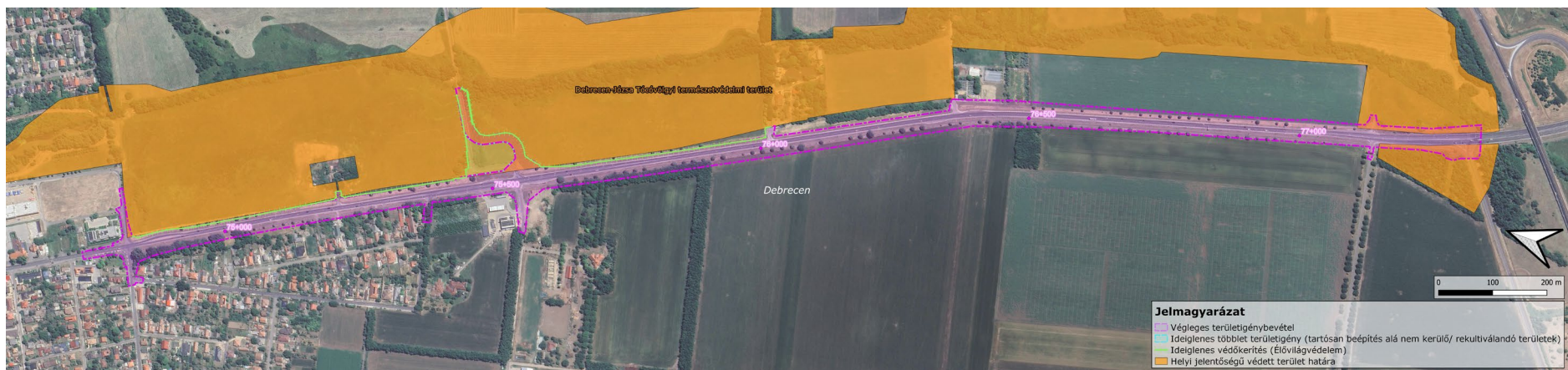
3. ábra: Helyi jelentőségű védett területek a hatásterület környezetében