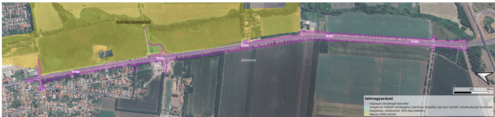
2. ábra: Natura 2000 területek a hatásterület környezetében