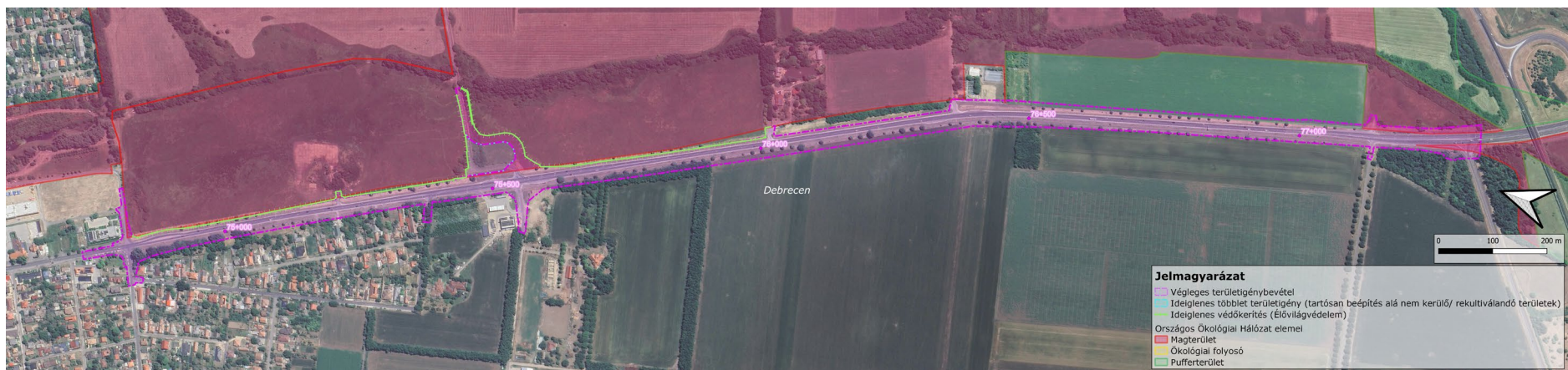
4. ábra: Az Országos Ökológiai Hálózat elemei a hatásterület környezetében