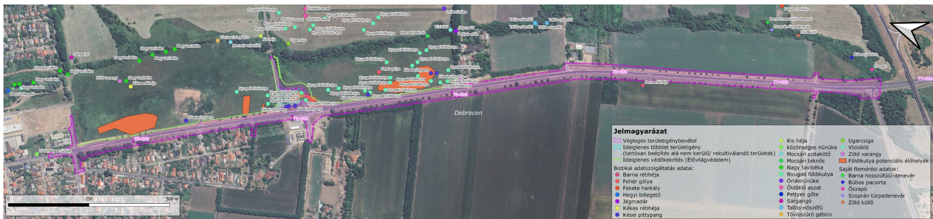
5. ábra: A terepi felmérések során szerzett tapasztalatok, valamint a Hortobágyi Nemzeti Park Igazgatóság (HNPI) adatszolgáltatása alapján rendelkezésre álló, a hatásterületen előforduló védett fajokra vonatkozó adatok