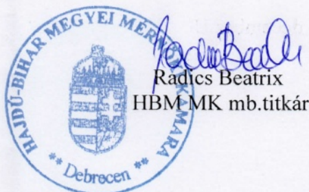
Radics Beatrix HBM-MK mb.titkár