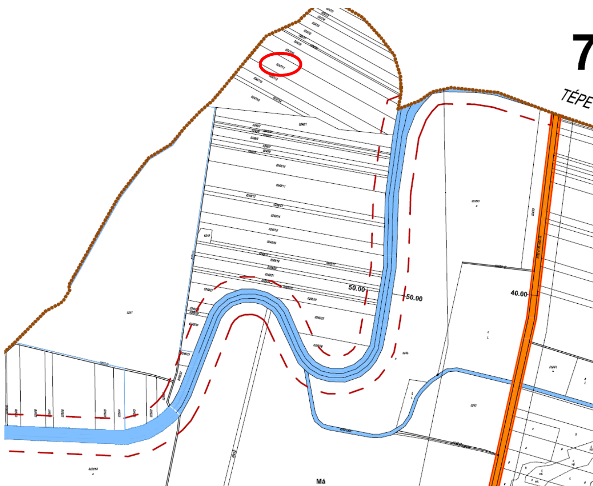
2. ábra: Telepítési helyszín településrendezési térképen - Berettyóújfalu

4. pont: az 1. és 2. ábrán bemutatjuk a tervezett telepítési helyet és annak környezetét a település-rendezési tervek vonatkozó részterületeinek ábrázolásával. Ennek alapján látható, hogy az öntözni tervezett ingatlanok és azok közvetlen környezete egyaránt általános mezőgazdasági terület (Má) besorolásba tartozik.