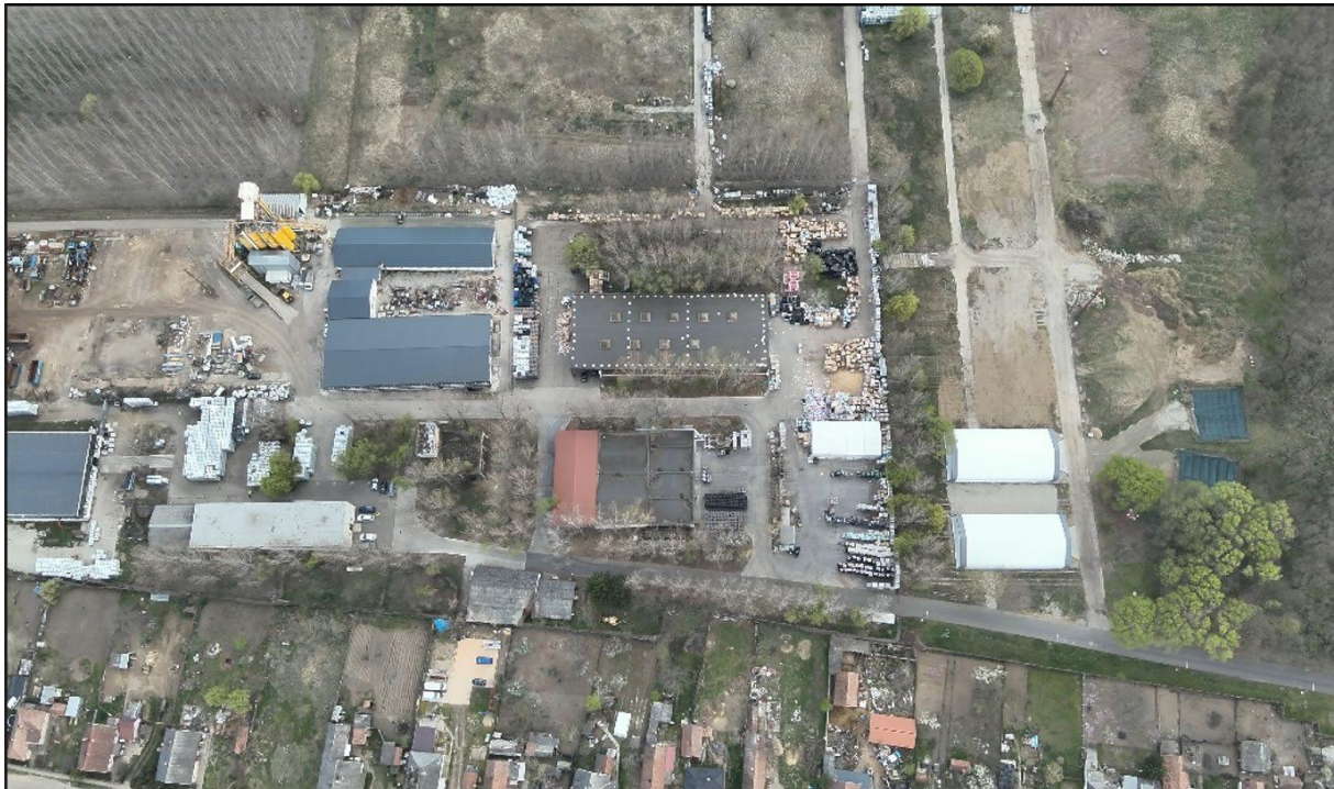
1. ábra: a telephely átnézeti elhelyezkedése

Ezen tárolóhelyeken kerülnek elhelyezésre az ALTEO Circular Kft. tevékenysége során gyűjtött, hasznosításra átvett és/vagy előkezelt, valamint kezelés során másodlagosan keletkezett veszélyes és nem veszélyes hulladékok.