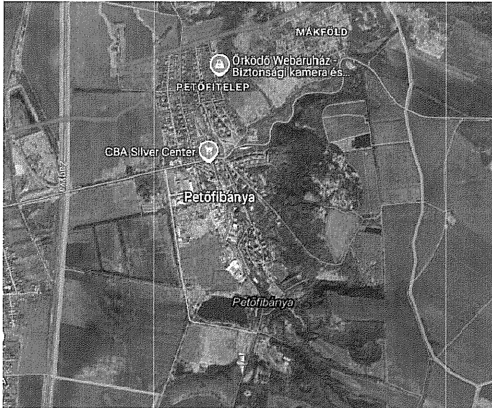
2. ábra a helyszínen felvett GPS koordináta térképi megjelenítése