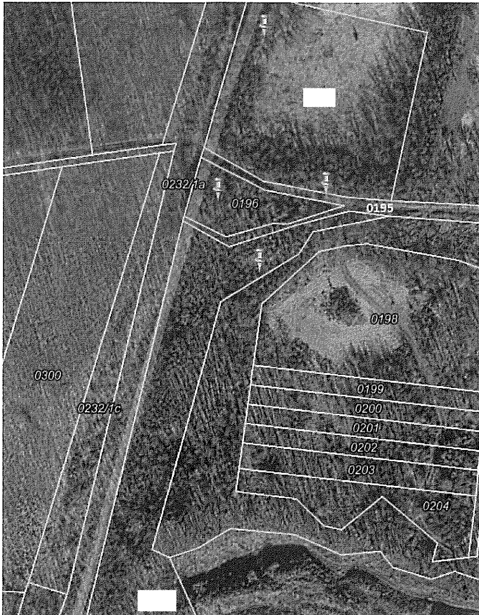
1. ábra a helyszínen felvett GPS koordináta térképi megjelenítése