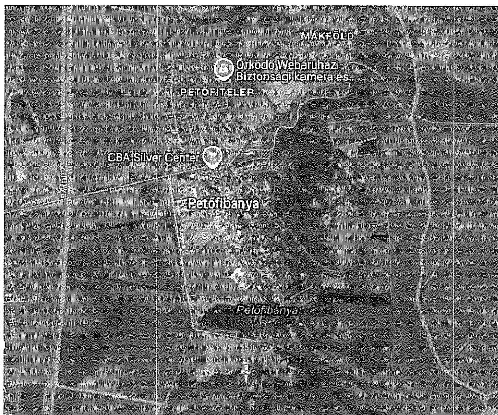
2. ábra a helyszínen felvett GPS koordináta térképi megjelenítése