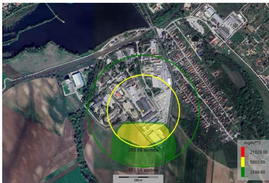
A raktártűz esemény hatásterülete SO 2 komponens esetén

A nyilvános biztonsági jelentés adatai alapján a lehetséges legnagyobb károsító hatás(ok) területi eloszlását az alábbi ábra tartalmazza: