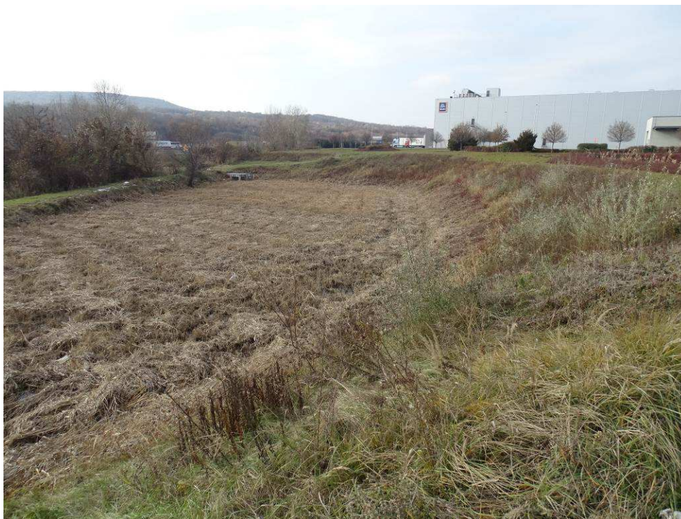
A telephely déli nádas, tartósabban vízborította csapadékvíztárolója a rézsún felsarjadó ezüsthégyekkel, háttérben a parton lévő fehér fűz és az M1 autópálya felé néző rézsú akác- fehér nyaras facsoportjaival