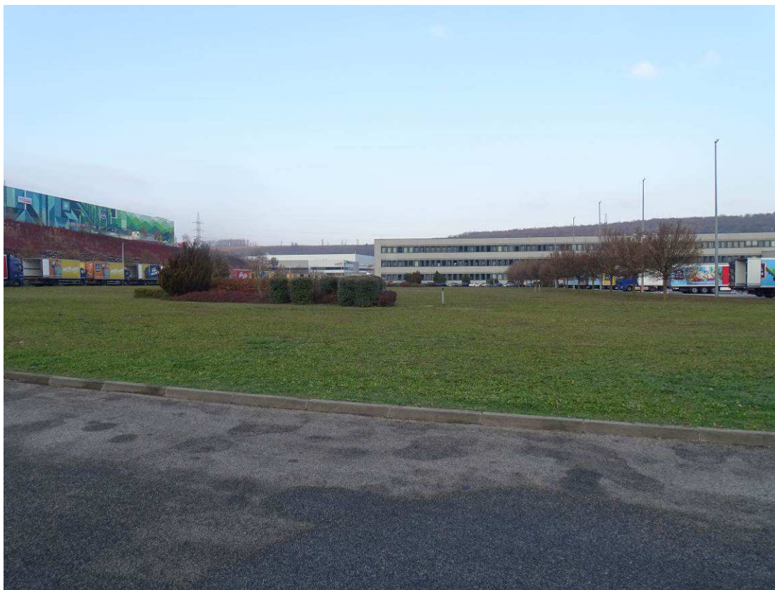
A délnyugati raktárbővítés miatt eltűnő parktükör a telephely délnyugati részén díszcserjésekkel és a parktükör keleti szélén mezei juharos fasorral háttérben az irodával és a telephely nyugati kerti madárbirssel befuttatott részsűjével