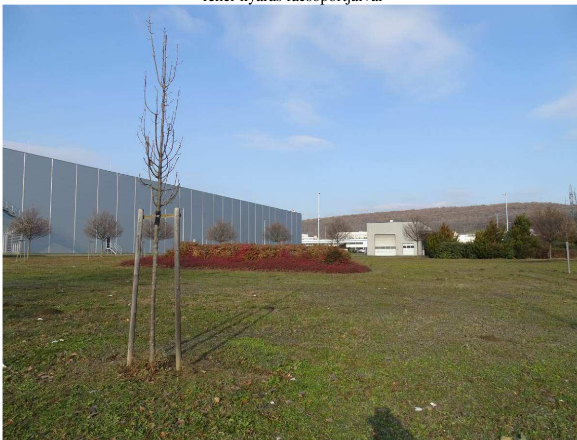
A csapadékvíztározótól nyugatra lévő parkosítás kerti madárbirssal, virginiai borókával, ráncoslevelű bangitával és magas kőrises és mezei juharos fasorokkal