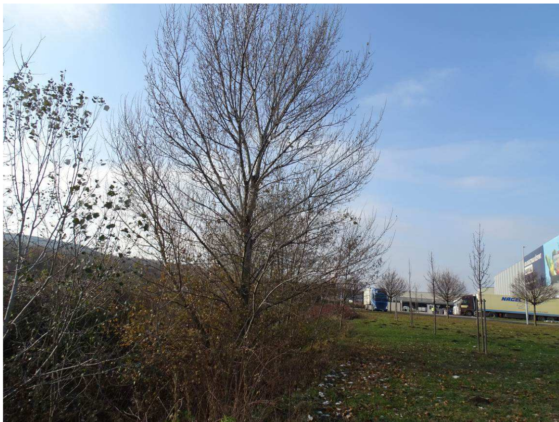
A telephely déli szélén lévő M1 autópálya felé néző letörés fehér nyárral a raktár délkeleti csücskét határoló út délkeleti szélén magas kőrises és mezei juharos fasorral