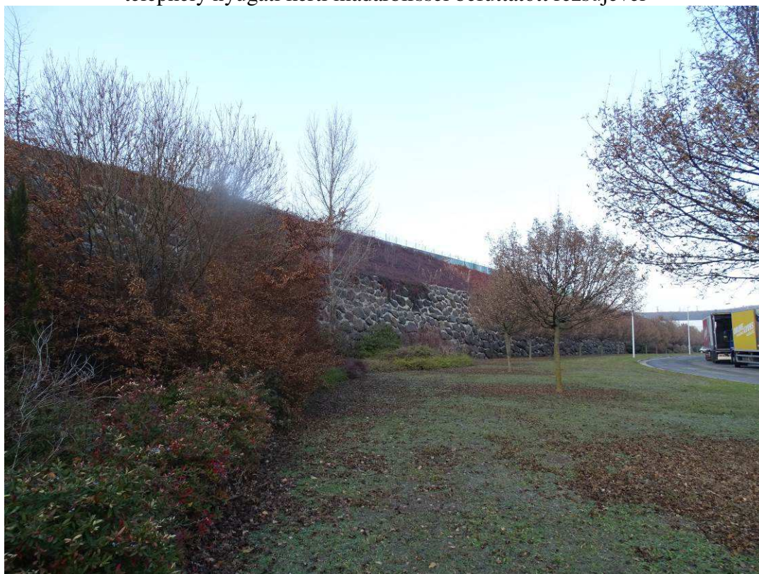
A telephely nyugati szélén lévő részsű kőfalának tövében lévő parkosítás (rezgőnyár, gyertyán, julián borbolya) és a telephely nyugati szélén lévő út nyugati szélét kísérő mezei juharos fasorral és a telephely nyugati kerti madárbirssel befuttatott, nádasodó részsűjével