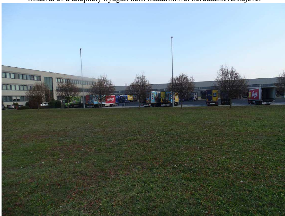
A délnyugati raktárbővítés miatt eltűnő parktűkör keleti szélén a nyugati rakodó kamionparkolójánál lévő mezei juharos fasor