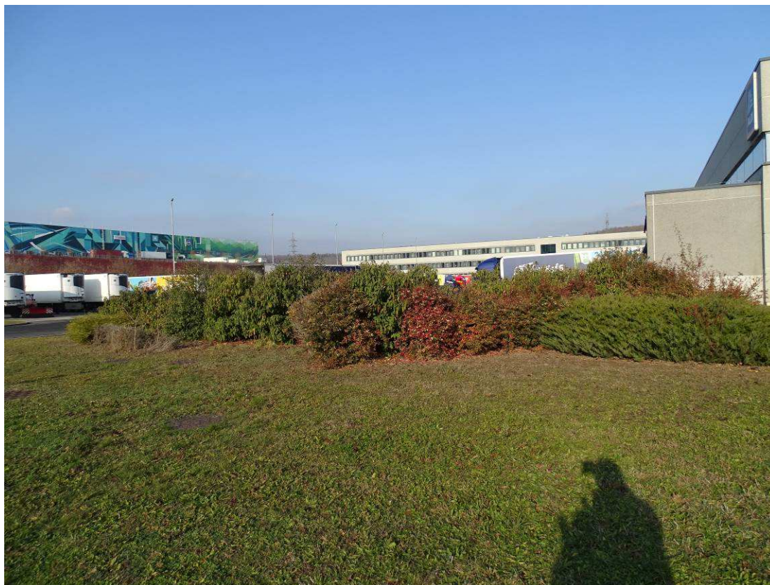
A délnyugati raktárbővítéssel eltűnő díszcserjés sáv a raktár délnyugati csücskén háttérben az irodával és a telephely nyugati kerti madárbirssal befuttatott részsűjével