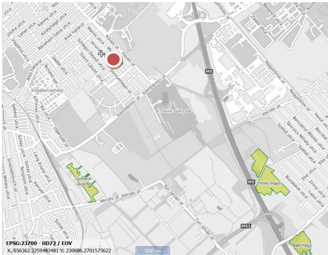
1. ábra. Ex lege védett lápok a telephely környékén (telephely körrel jelölve) (forrás: OKIR)