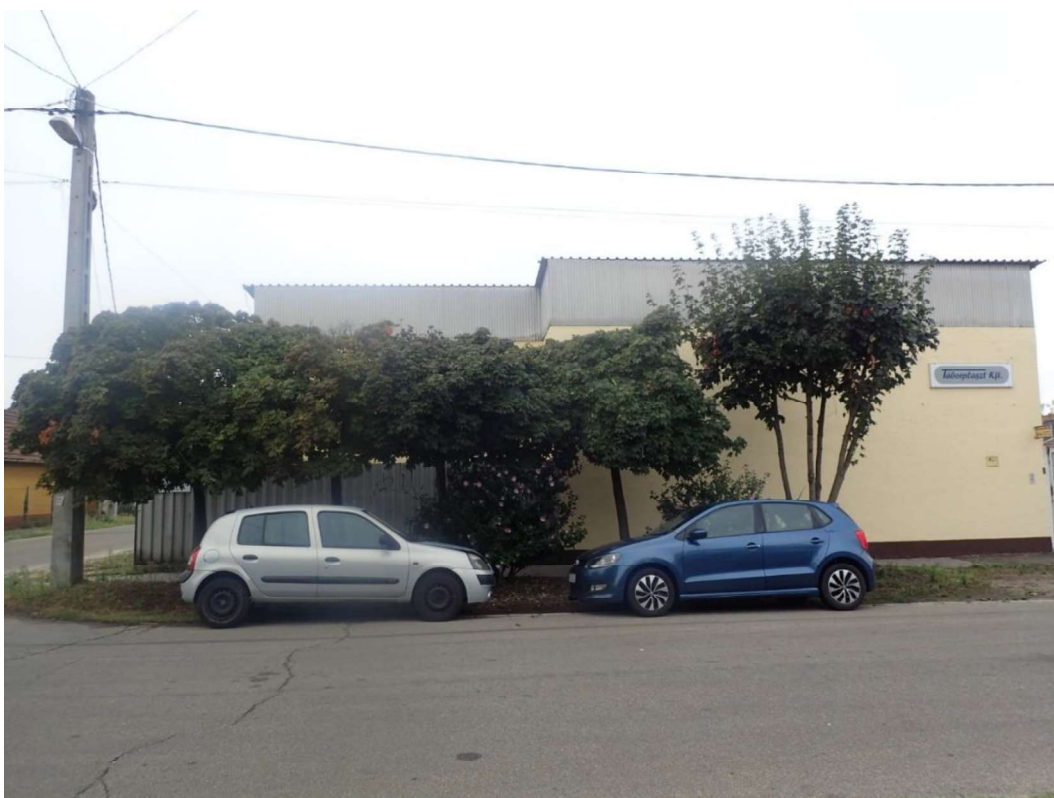
2. kép. Juharfák ( Acer platanoides , A. pseudoplatanus ) és mályvacserjék ( Hibiscus syriaca ) a telephely előtt a Hrivnák Pál utcában (felvétel időpontja: 2025. augusztus 31.)