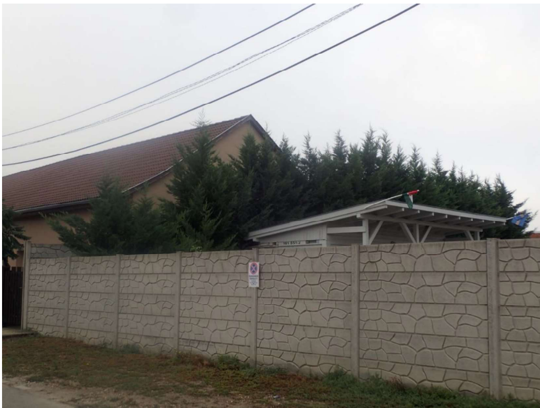
1. kép. Leyland-ciprusok ( Cupressocyparis x leylandii ) a telephelyen (felvétel időpontja: 2025. augusztus 31.)