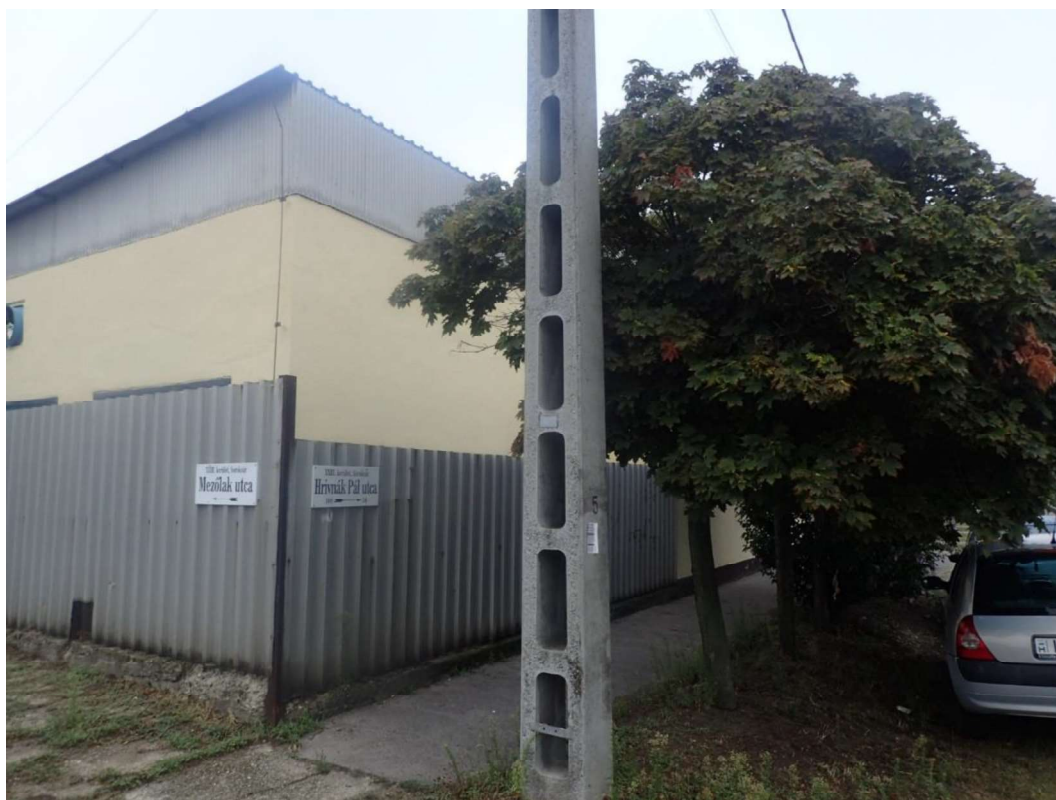
3. kép. Mezőlak utca – Hrivnák Pál utca kereszteződése, s telephely (épület) előterében juharfákkal ( Acer platanoides ) (felvétel időpontja: 2025. augusztus 31.)